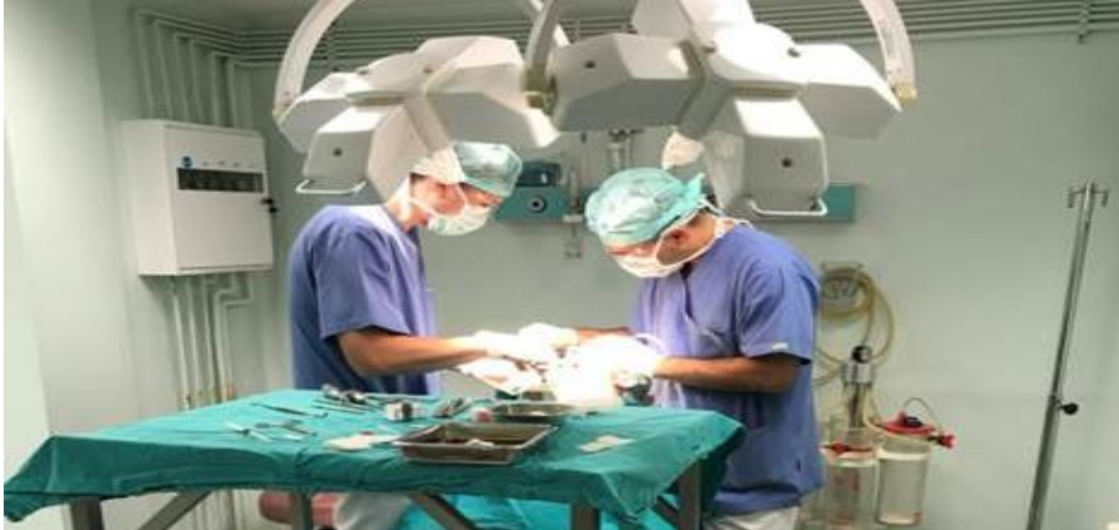
Ağız, Diş ve Çene Cerrahisi Ameliyathanesi