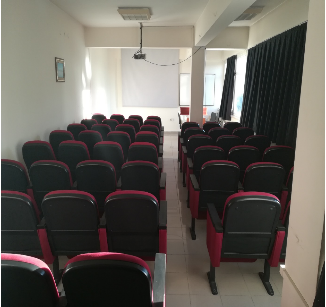
Tablo 6. SBÜ Toplantı ve Konferans Salonları

(Sağlık Bakanlığı Ankara İl Sağlık Müdürlüğü ile yapılan protokol kapsamında tahsis edilen ders salonu)