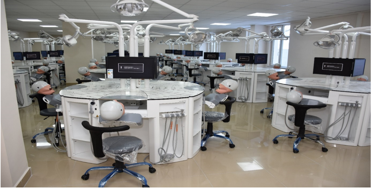
Gülhane Diş Hekimliği Fakültesi Fantom Simülasyon laboratuvarı