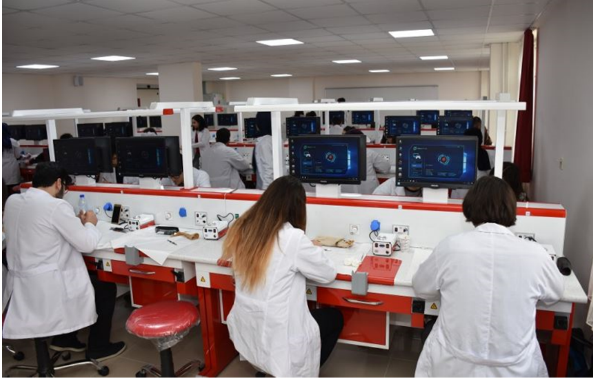
Gülhane Diş Hekimliği Fakültesi Klinik Öğrenci laboratuvarı