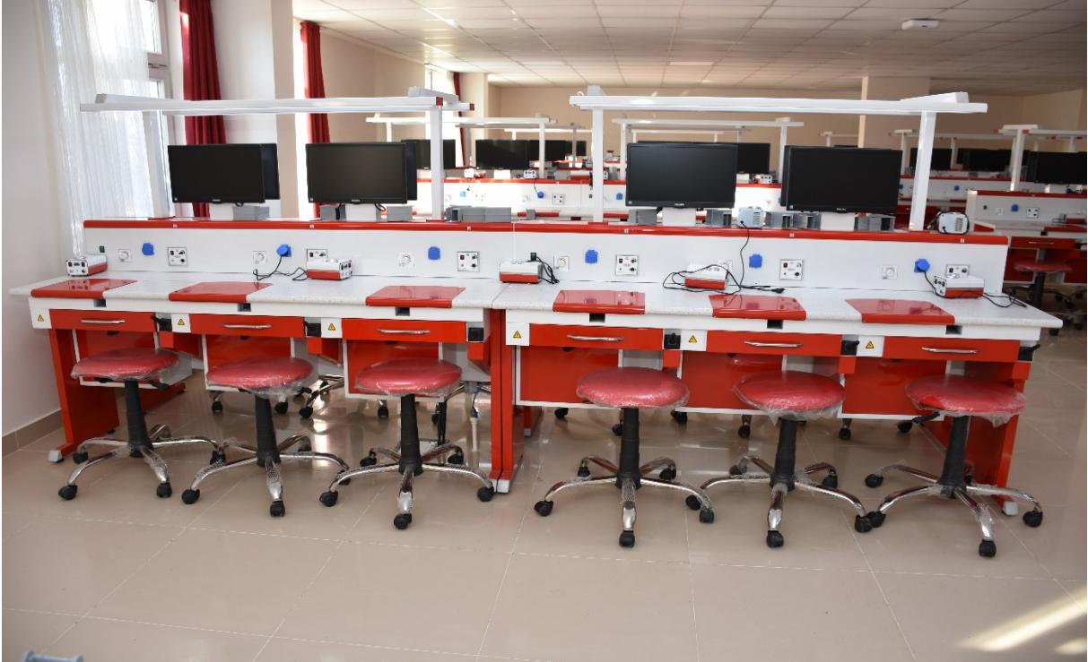
Gülhane Diş Hekimliği Fakültesi Klinik Öğrenci laboratuvarı