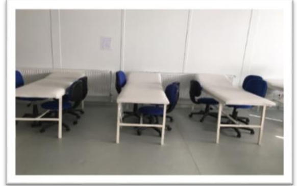
Fizyoterapi ve Rehabilitasyon Laboratuvarı