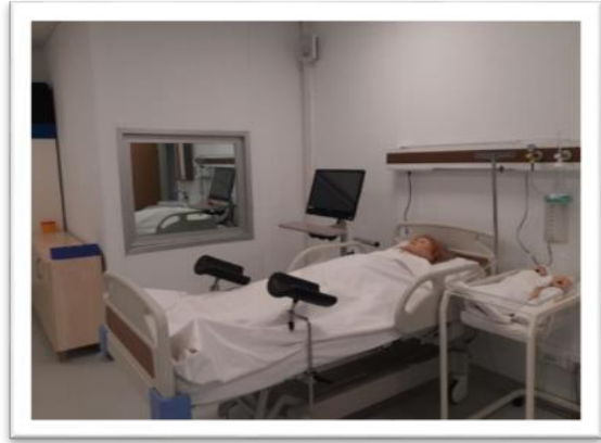
Hemşirelik Simülasyon Laboratuvarı