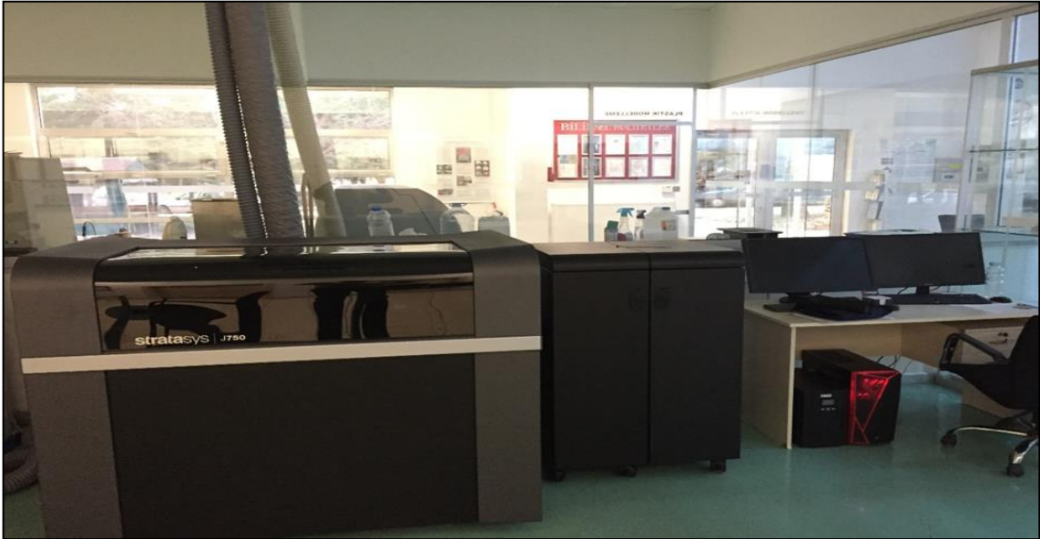
Medikal Tasarım ve Üretim Merkezi Teknolojik Cihaz Modernizasyonu

4. 2017H037290 No'lu “Yayın Alımı”: Proje başlangıç ödeneği 500.000TL olup nakdi gerçekleşmesi 458.285TL'dir. Gerçekleşme seviyesi %92 olmuştur. Proje kapsamında tüm akademik ve idari birimlerin ihtiyacına binaen basılı yayın alımları tedarik edilmiştir.