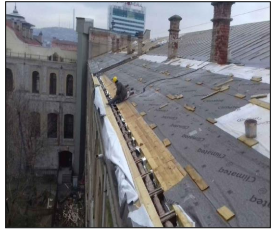
Mekteb-i Tıbbiye-i Şahane Binası Restorasyon İşi