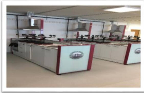
Beslenme ve Diyetetik Laboratuvarı