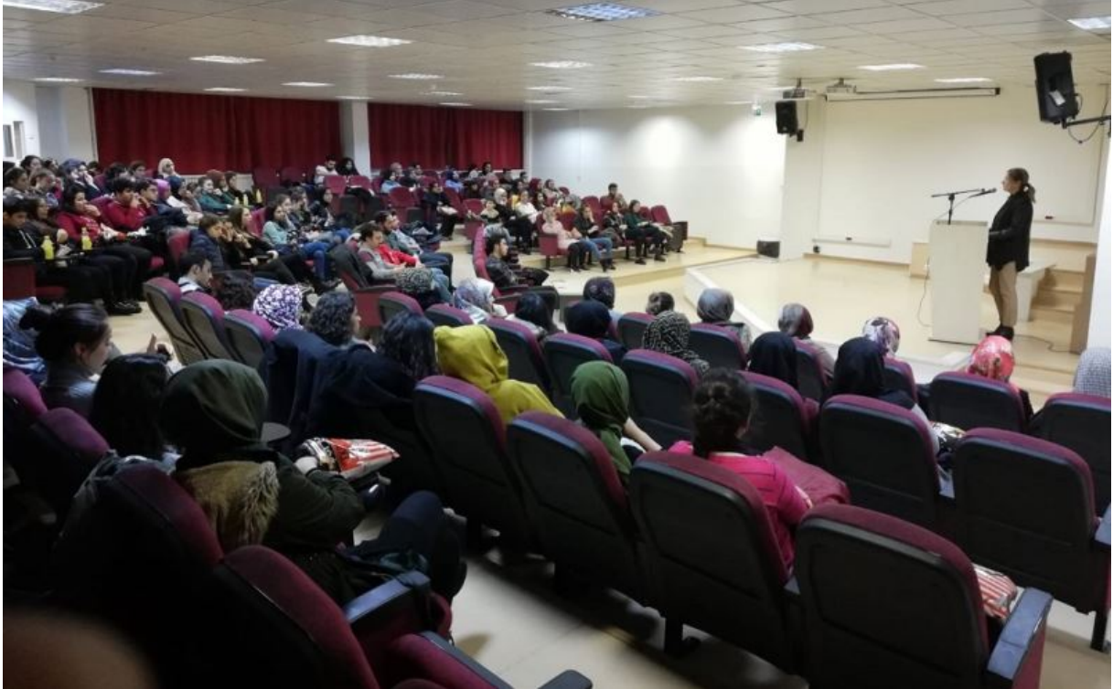
Gülhane Hemşirelik Fakültesi Öğrencileri İle Paylaşım Saati Toplantısı (04 Aralık 2018)