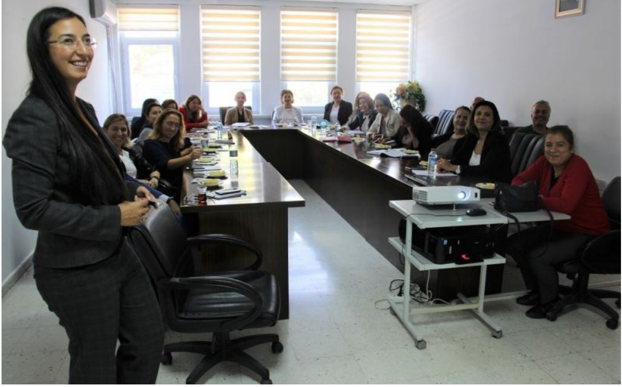
3 Aralık Dünya Engelliler Günü Farkındalık Etkinliği (04 Aralık 2018)