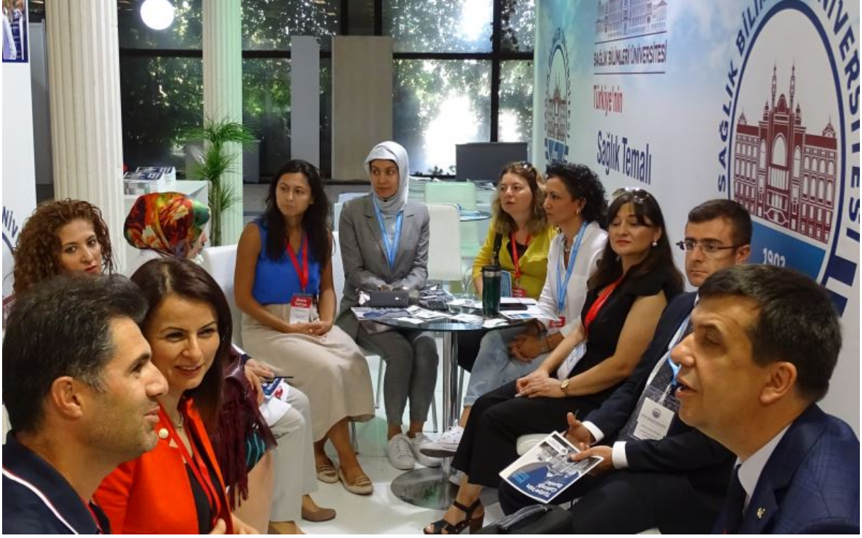
Simülasyon Eğitici Eğitimi (10-12 Eylül 2018)