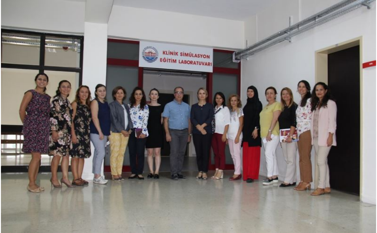
Sağlık Bilimleri Üniversitesi (SBÜ) Gülhane Hemşirelik Fakültesi 2018-2019 Eğitim Öğretim Yılı Açılışı (26 Eylül 2018)