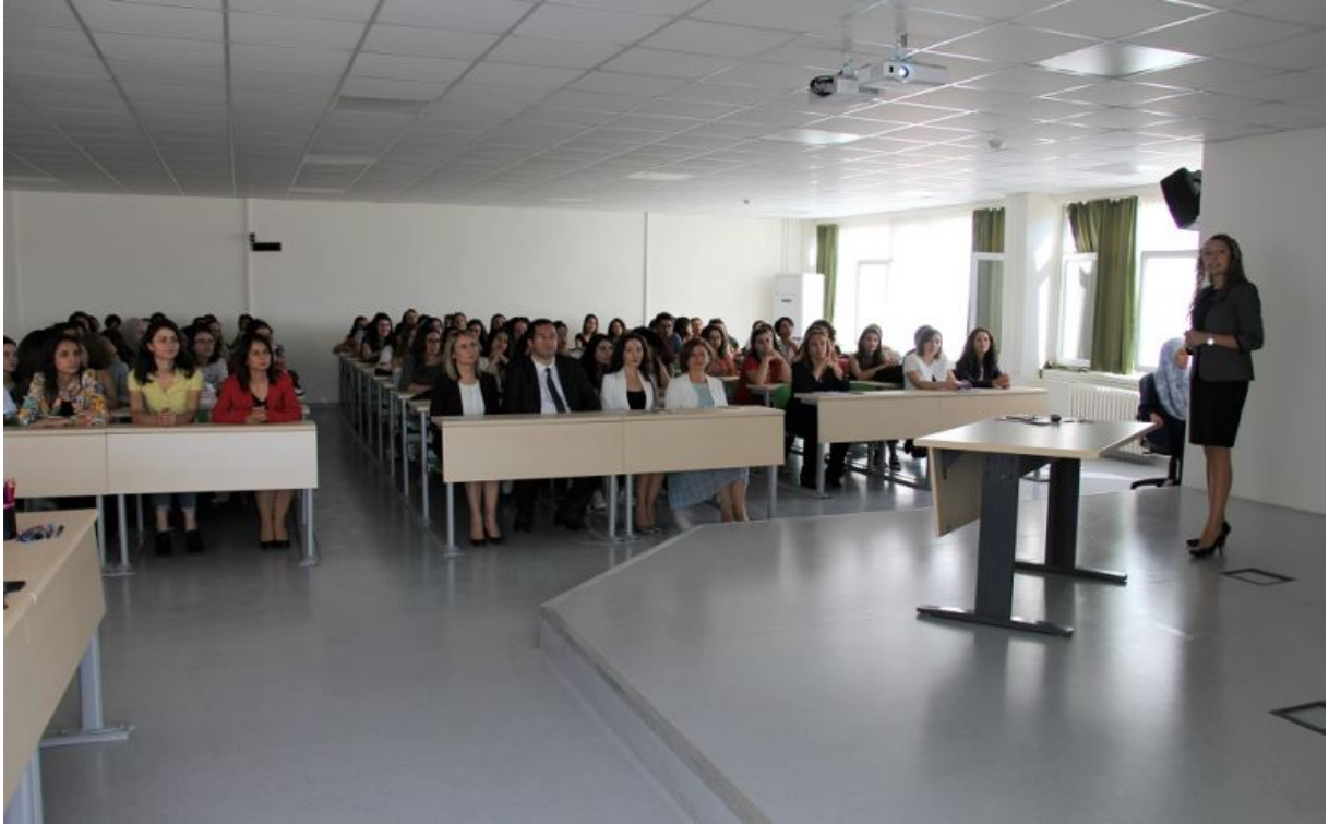
Sınai Mülkiyet Hakları ve Patent Eğitimi 03 Ekim 2018)