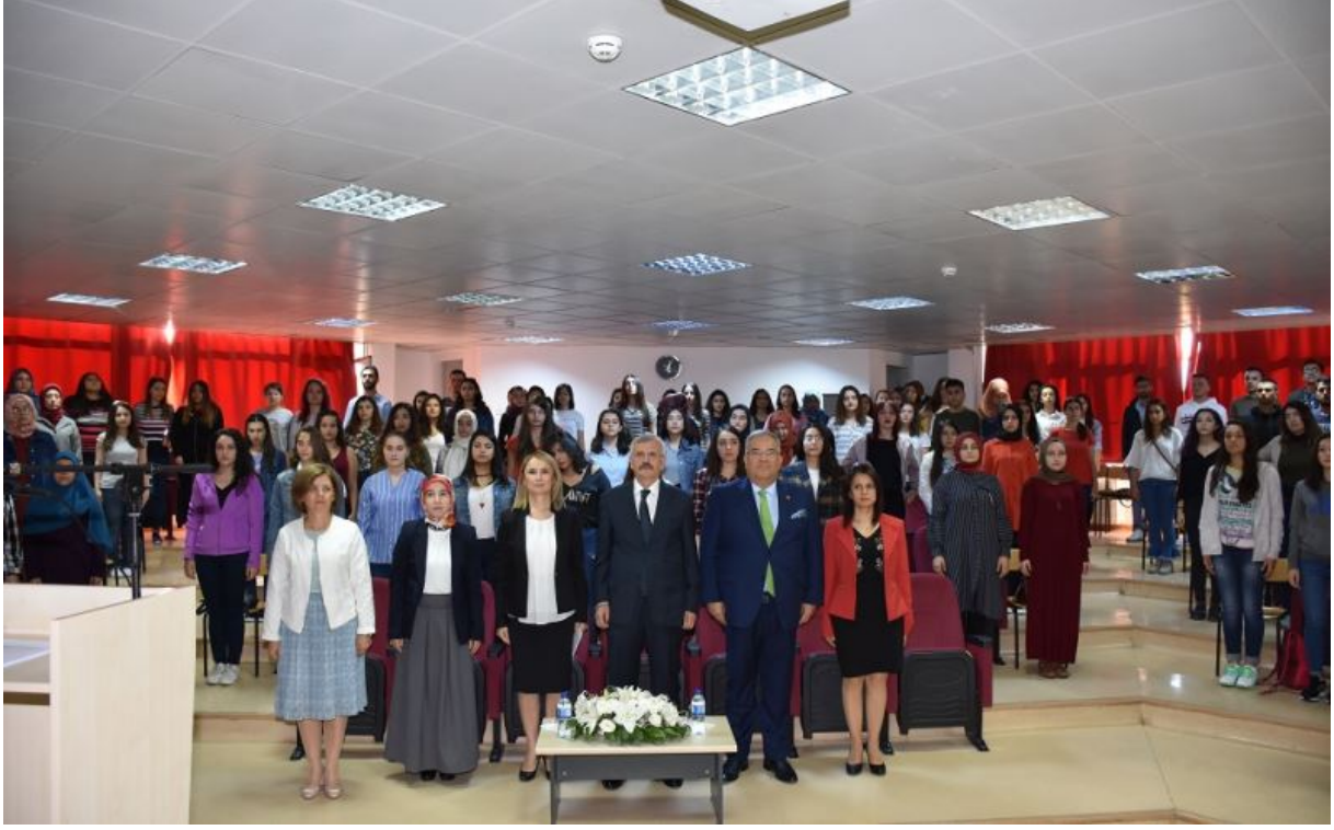
SBÜ Gülhane Hemşirelik Fakültesi 2018-2019 Eğitim-Öğretim Yılı İntörn Oryantasyon Programı (24-26 Eylül 2018)