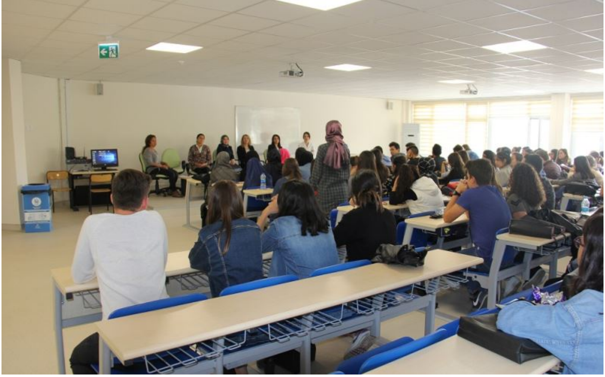
“İletişim: Benden Ötekine Yolculuk” Kursu (25 Aralık 2018)