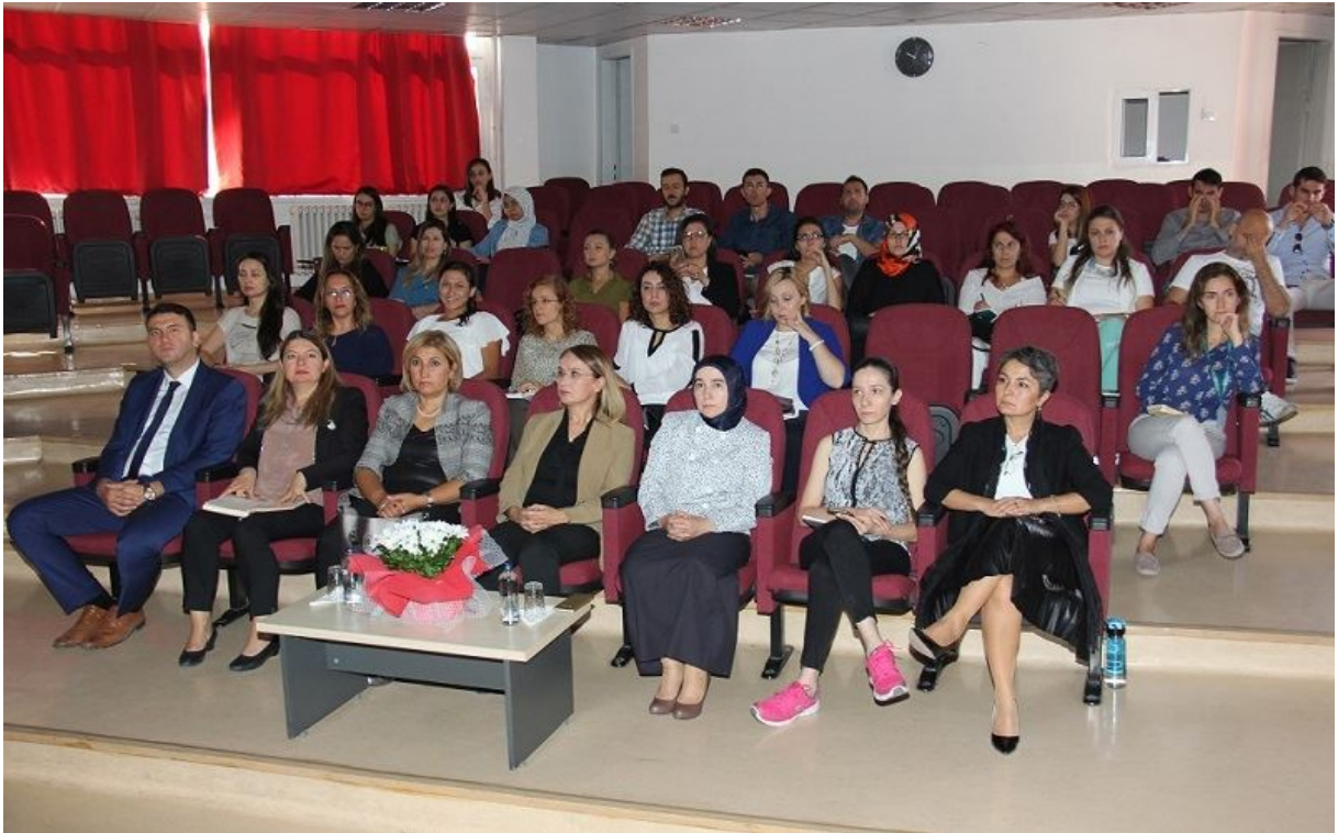
Sağlık Bilimleri Üniversitesi Tanıtım Günleri (23-24 Temmuz 2019)