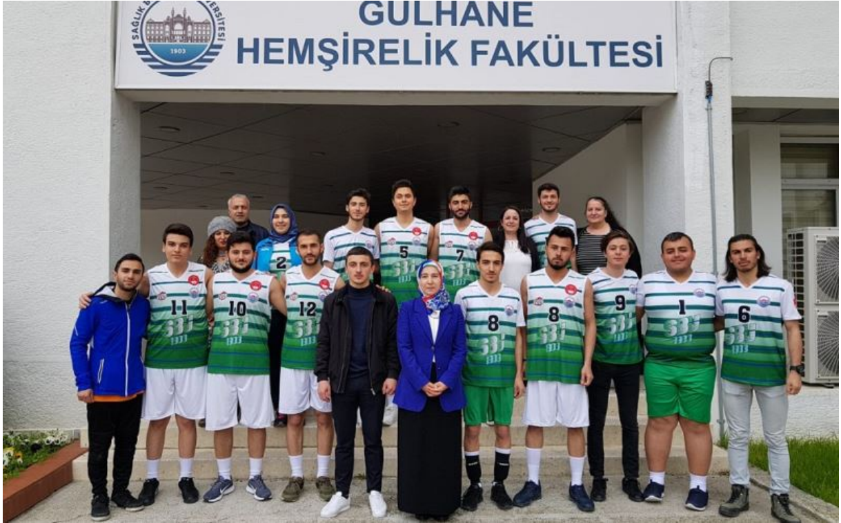
Öğrencilerimiz Uygulama Yaptıkları Hastanelerden Teşekkür Belgesi Aldılar ( 24-04-2019)