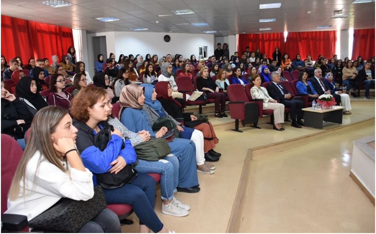
TÜBİTAK ARDEB Programları Bilgilendirme Toplantısı (19.09.2019)