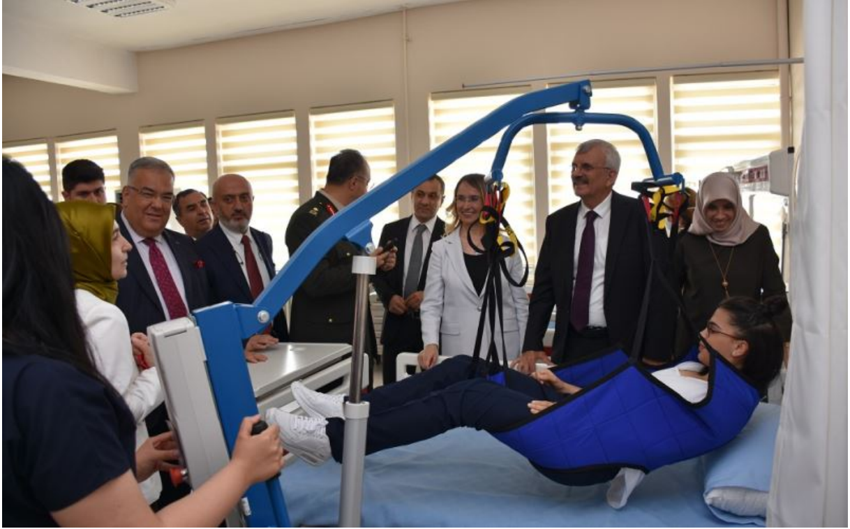
Mezuniyet Töreni (30 Mayıs 2019 )