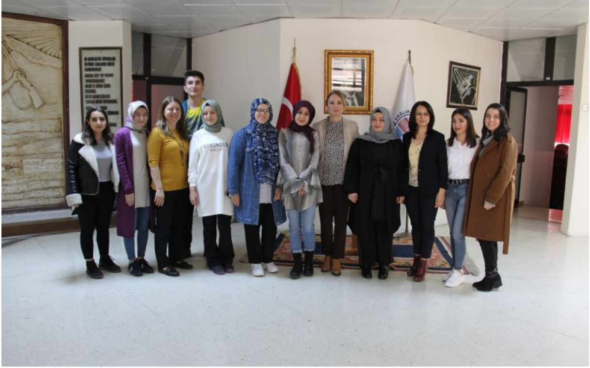
Kariyer Planlama Etkinliđi (19 Nisan 2019)