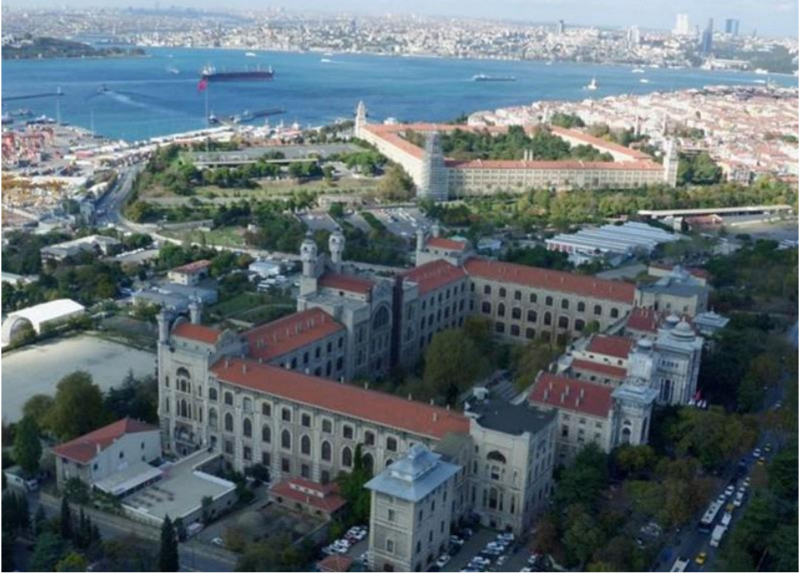
Saęlık Bilimleri Üniversitesi Haydarpařa Kampüsü, Selimiye, Üsküdar