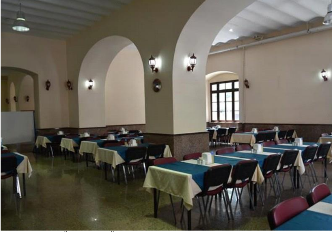
Sağlık Bilimleri Üniversitesi Öğrenci Yemekhanesi