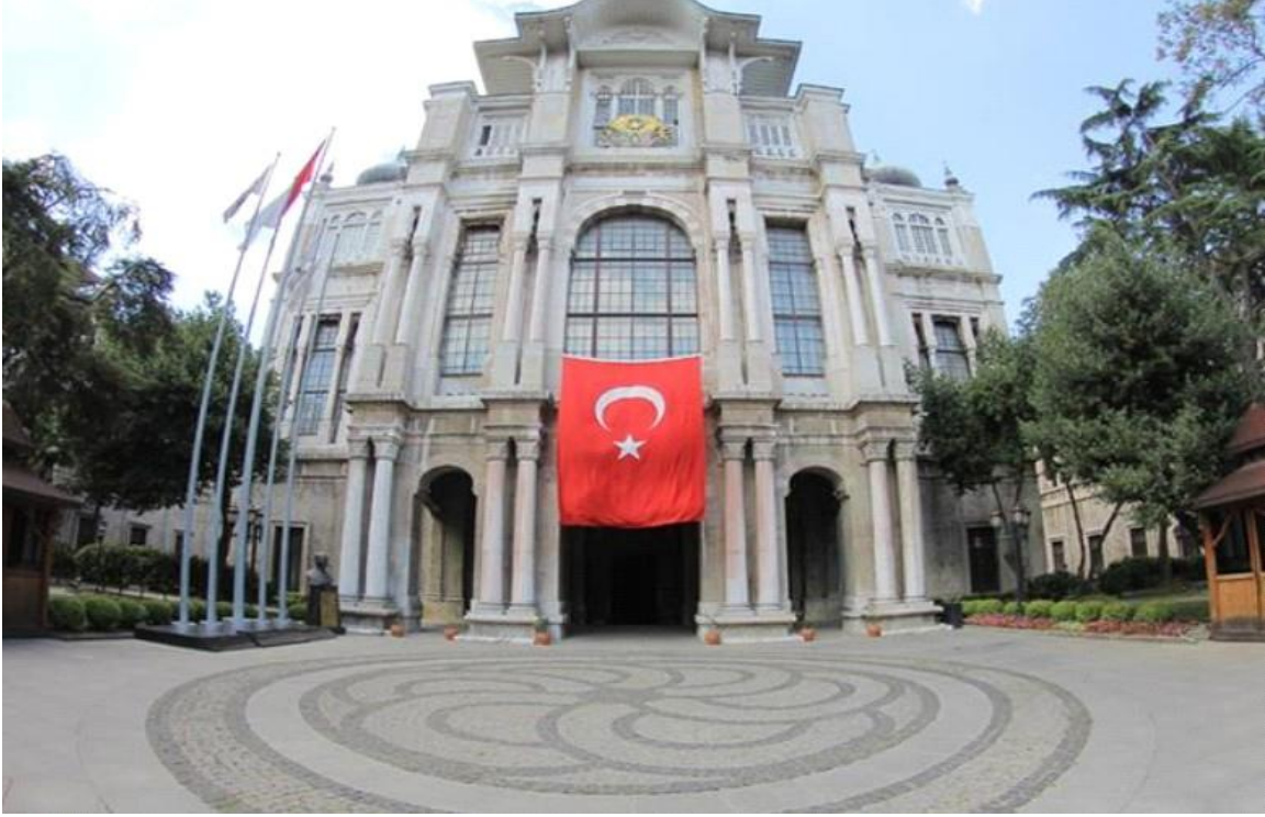
Sağlık Bilimleri Üniversitesi Haydarpaşa Kampüsü, Selimiye, Üsküdar