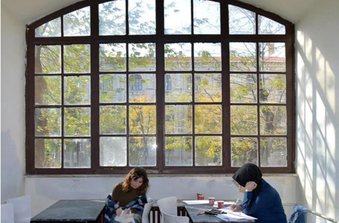
Sağlık Bilimleri Üniversitesi Öğrenci Çalışma Alanları