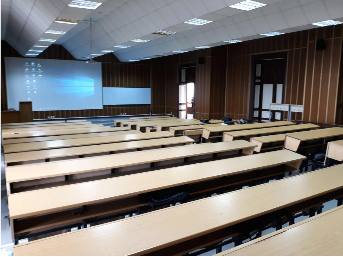
Sağlık Bilimleri Üniversitesi Hamidiye Diş Hekimliği Fakültesi Amfisi