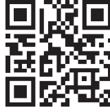
Sporfest Müsabaka Genel Kuralları